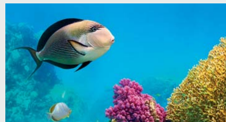
TABELLA PREZZI pag. 348