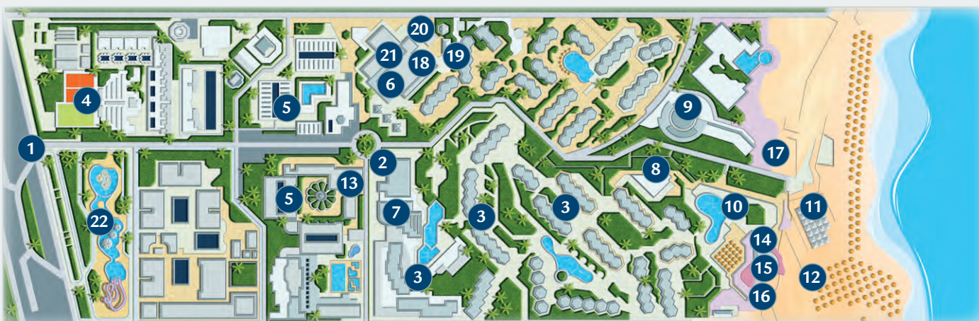
TABELLA PREZZI pag. 347