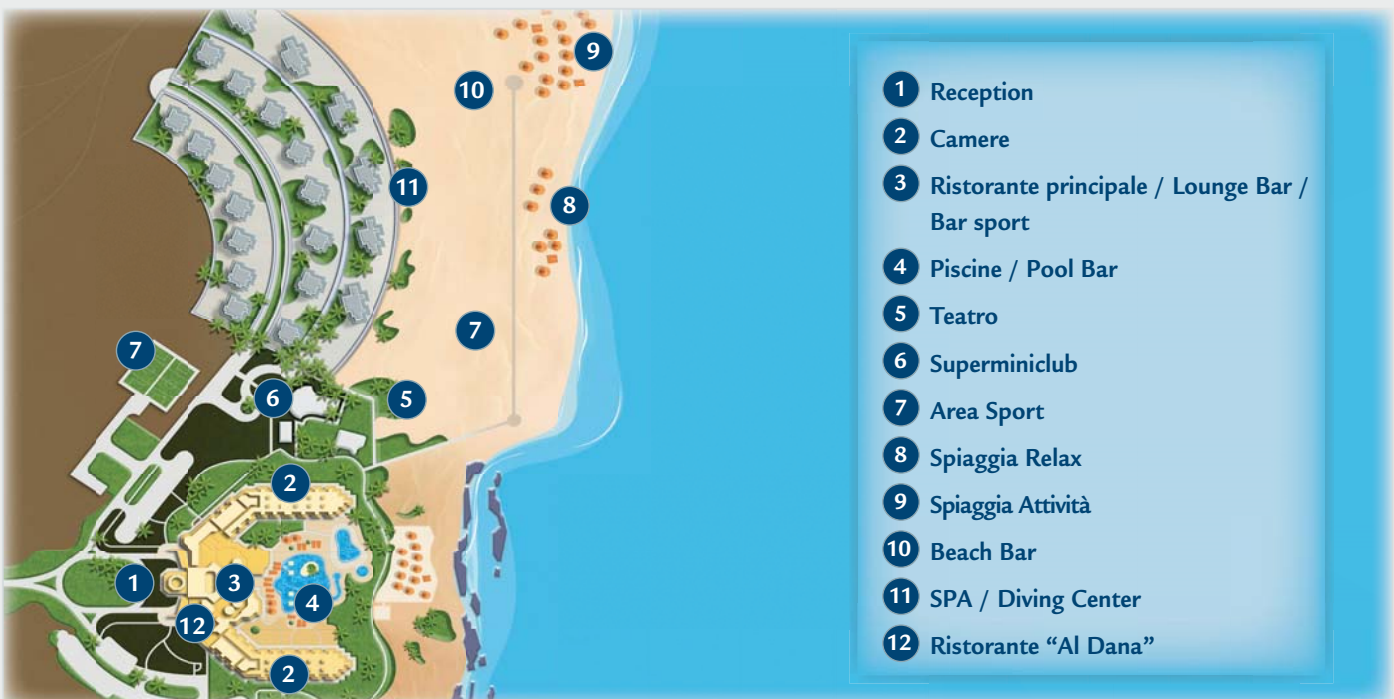
TABELLA PREZZI pag. 362