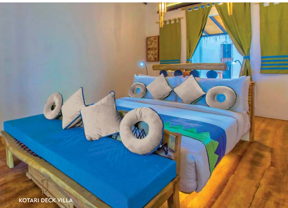
KOTARI DECK VILLA