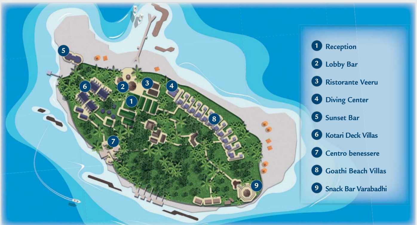
TABELLA PREZZI pag. 355