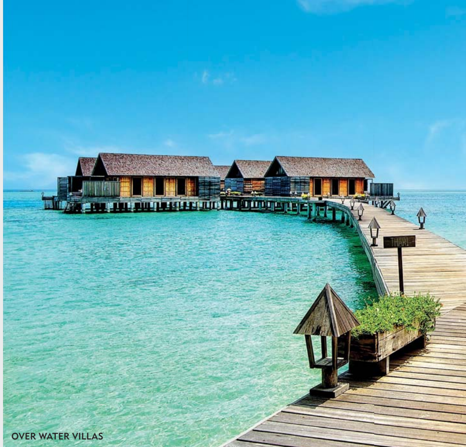
OVER WATER VILLAS