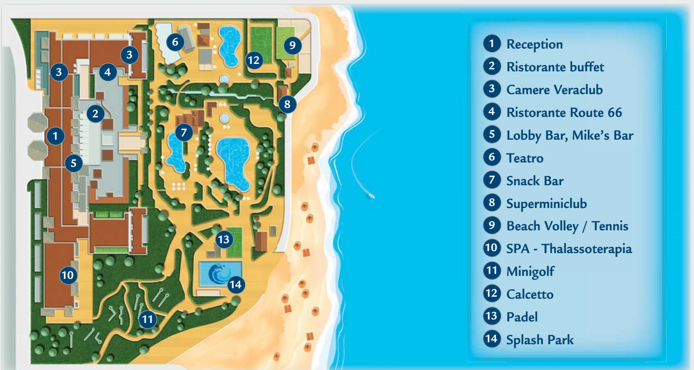
TABELLA PREZZI pag. 339